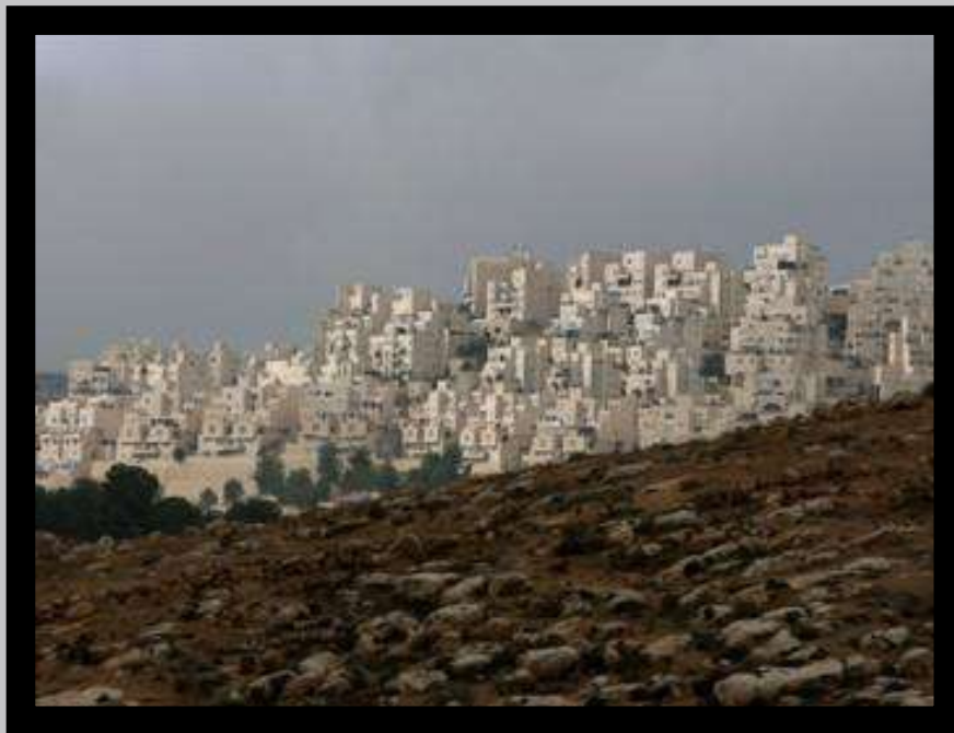
Vista del asentamiento Judío de Har Homa, en Jerusalén Este